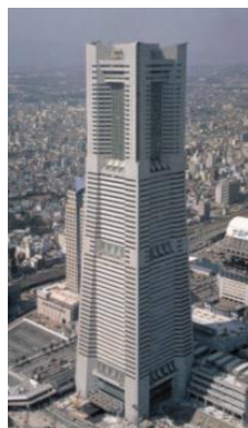
(横浜ランドマークタワー)

対象建築物は、オフィスビル、高層マンション、大型ショッピングセンター、駐車場、トンネルなど。