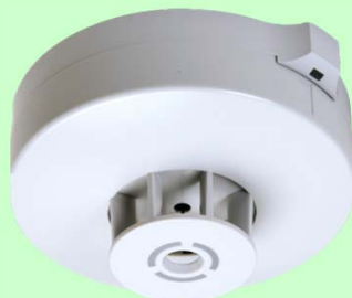
定温式スポット型感知器(1種)