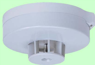
差動式スポット型感知器