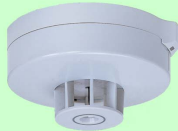
定温式スポット型感知器(特種)