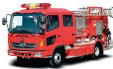
(水槽付消防ポンプ自動車)