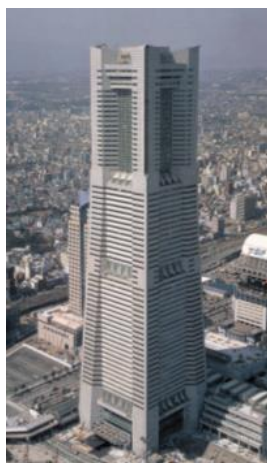
(横浜ランドマークタワー)

60年の歴史を持つ同社において最も実績のある分野。 対象建築物は、オフィスビル、高層マンション、大型ショッピングセンター、駐車場、トンネルなど。