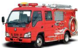
(消防ポンプ自動車)