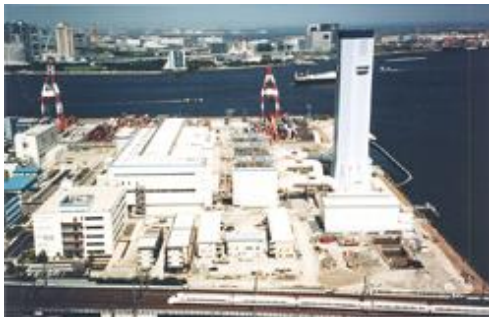
(東京電力 品川火力発電所)

原子力、火力、ガス、石油、石炭などさまざまなエネルギープラントから、石油化学、医薬、鉄鋼など広範な産業分野の製造工場および倉庫などが対象。