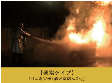
【通常タイプ】 10型消火器(消火薬剤3.0kg)