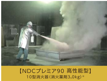
【NDCプレミア90 高性能型】 10型消火器(消火薬剤3.0kg)*