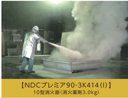
【NDCプレミア90-3K414(I)】 10型消火器(消火薬剤3.0kg)