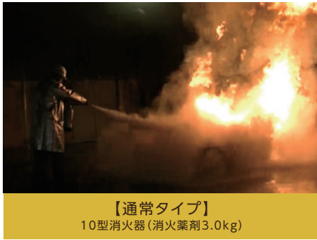
【通常タイプ】 10型消火器(消火薬剤3.0kg)